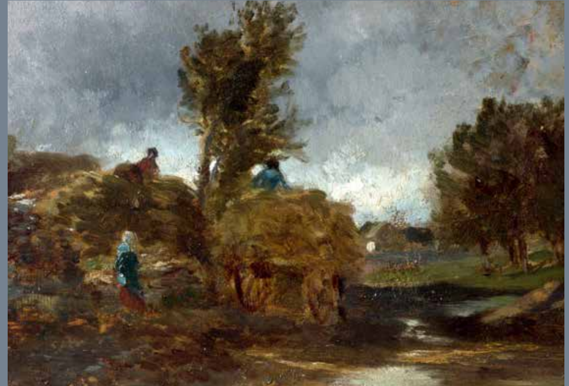
Constant Troyon (1810–1865), Landschap met hooiwagen, z.d., olieverf op paneel, Museum Mesdag, Den Haag