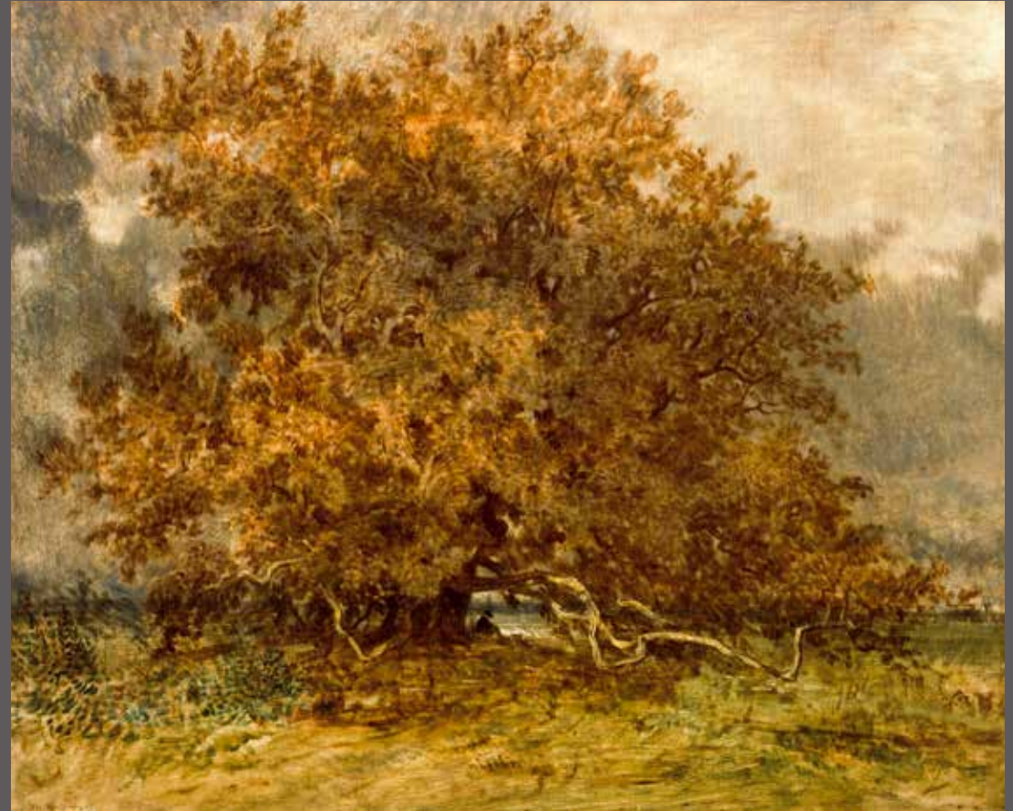
Théodore Rousseau (1812-1867), De gespleten boom bij Carrefour de l'Épine, 1852, olieverf op doek, Museum Mesdag, Den Haag