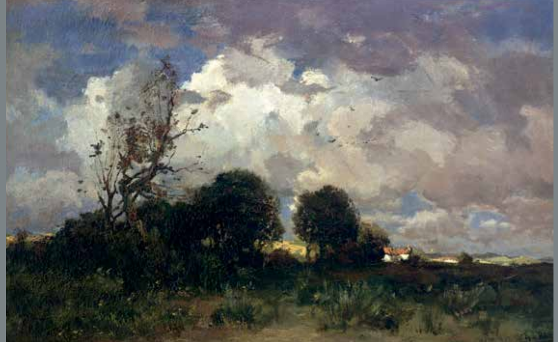
Théophile de Bock (1851–1904), Onweer, 1881, olieverf op doek, Museum Mesdag, Den Haag